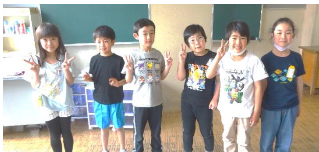
学校案内リーダー

学校案内が延期となり、本日実施することができました。学校案内の様子は、次号でくわしくお知らせします。学校案内も、次の校外学習もリーダーを中心に準備を進めています。学年の話し合いで提案する原案を決めたり、話し合いを進める練習をしたり、休み時間も大忙しで頑張っているところです。リーダーさんの頑張りがとても素晴らしいです。また、リーダーに協力する子ども達の姿も素晴らしいです。リーダーとそれを支える子ども達で、これからの活動を進め、学年として成長できるように指導していきます。