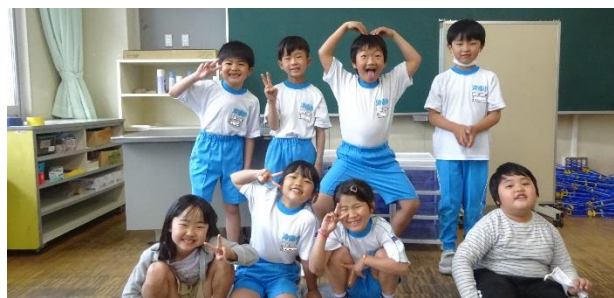
校外学習リーダー