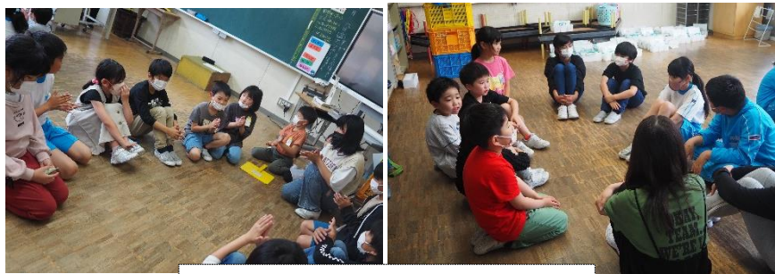
顔合わせの時の様子です

先週今年度初めてのブロック班活動を行いました。班ごと顔を合わせ、自己紹介しました。今週からはブロック班清掃が始まりました。6年生を中心に仕事を分担し、割り当てられた場所をきれいにしようと協力して掃除に取り組んでいます。